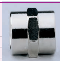
Confezione: 25 pz.