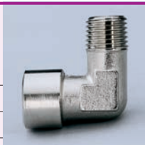
Confezione: 25 pz.