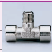
Confezione: 25 pz.