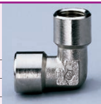
Confezione: 25 pz.