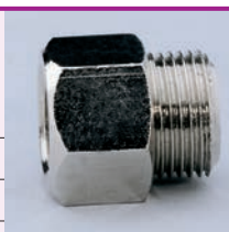
Confezione: 25 pz.