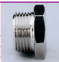
Confezione: 25 pz.