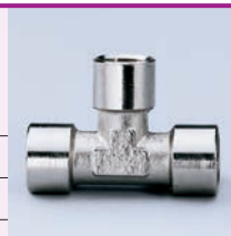
Confezione: 25 pz.