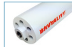
per altri diametri