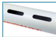
per diametri: 32 - 42 - 52 - 57