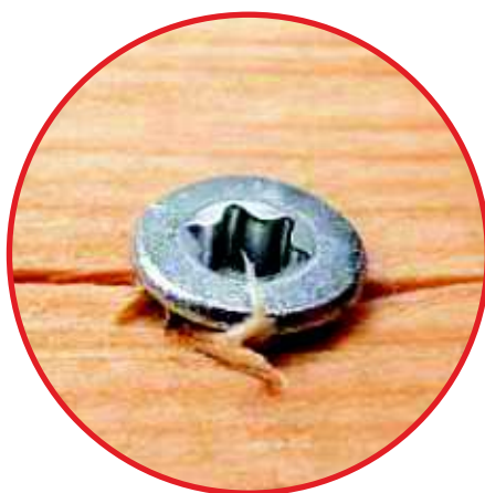
Una vite comune