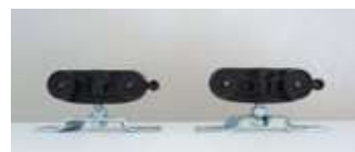
Carrelli di scorrimento con portata 100 kg