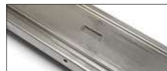
Sistema di bloccaggio della guida