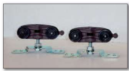
Carrelli di scorrimento con portata 100 kg