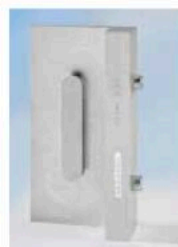
Dima a rilevamento per fori telaio cod. 1338556