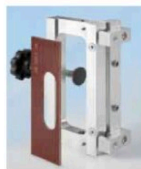
Dima di fresatura telaio cod. 1338688 e inserto cod. 1338687