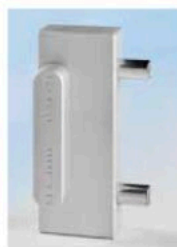
Dima a rilevamento per fori anta cod. 1338554