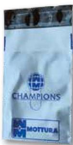
La busta sigillata