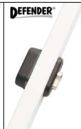
DEFENDER ESTERNO MOSTRINA INTERNA