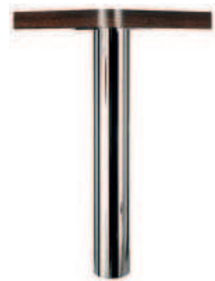
rotonda, cromato lucido