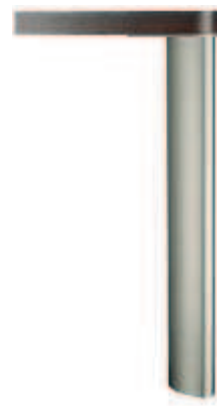
forma ellittica, spazzolato nichelato