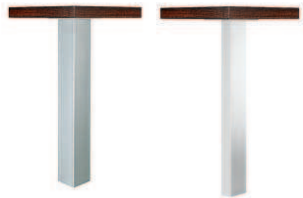
quadrata, bianco alluminio RAL 9006 opaco

1 gamba per tavolo 1 materiale di fissaggio per piastra da avvitare