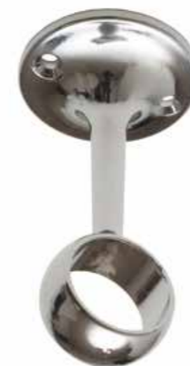
Reggitubo fisso aperto Open fixed tube bracket