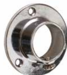
Ghiera fissa con vite Fixed ferrule with screw