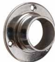
Ghiera svitabile Unscrewable ferrule