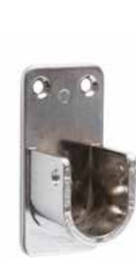
Reggitubo laterale con vite Lateral tube bracket with screw