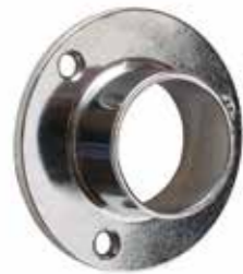
Ghiera fissa Fixed ferrule