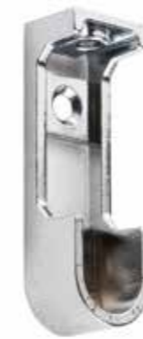
Reggitubo laterale Lateral tube bracket