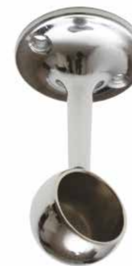
Reggitubo fisso chiuso Closed fixed tube bracket