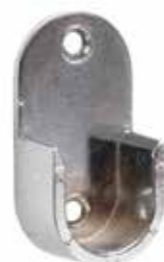
Reggitubo laterale Lateral tube bracket