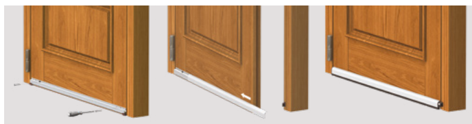
Applicazione sul lato interno

Meccanismo (BREVETTATO) con la discesa parallela del profilo mobile con guarnizione, caratterizzato dalla DOPPIA REGOLAZIONE (vite E: discesa - vite R: inclinazione) per una forte pressione omogenea su tutta la lunghezza.