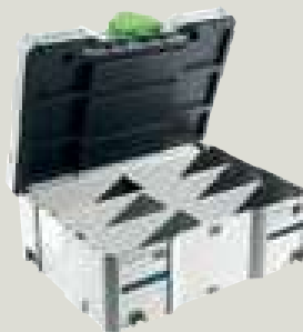
T-LOC SORT-SYS DOMINO 498889 Systainer SYS 2 T-LOC vuoto, con 3 box a scomparti variabili per la ripartizione individuale di tasselli DOMINO, in SYSTAINER SYS 2 T-LOC