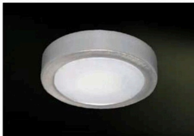
Photobiological Certification CLASS 0

3.5W LED spotlight for surface mounting with metal structure and polycarbonate ring and screen.