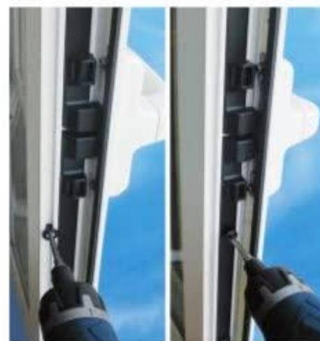
FOTO 3 I perni di aggancio possono essere avvitati sulle guide del profilato (A) o sull'asta cremonese (B).

POSIZIONE PERNI DI AGGANCIO Ad ante aperta, si apre il braccetto per verificare la corrispondente posizione per il fissaggio dei perni di aggancio A e B. In questa fase si verifica anche la giusta collocazione del braccetto che non deve interferire sul movimento comando della cremonese.