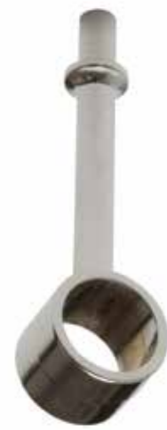
Reggitubo con beccuccio aperto Tube bracket with lip open