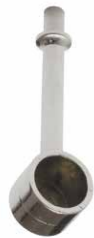
Reggitubo con beccuccio chiuso Tube bracket with lip closed