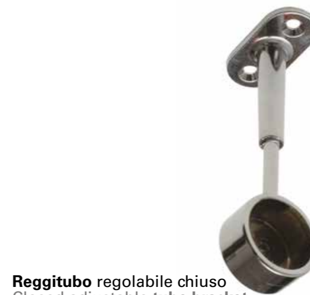
Reggitubo regolabile chiuso Closed adjustable tube bracket