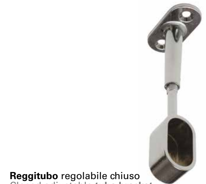
Reggitubo regolabile chiuso Closed adjustable tube bracket