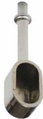
Reggitubo con beccuccio chiuso Tube bracket with lip closed