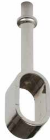
Reggitubo con beccuccio aperto Tube bracket with lip open