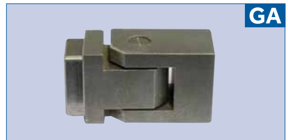
Cerniera di angolo con rotazione 90° 90° rotating angle hinge Charnière d'angle rotation 90°