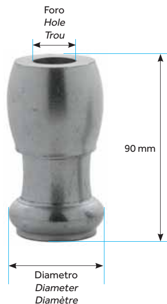
DISTANZIALE APERTO ADJUSTABLE OPEN ENTRETOISES OUVERT