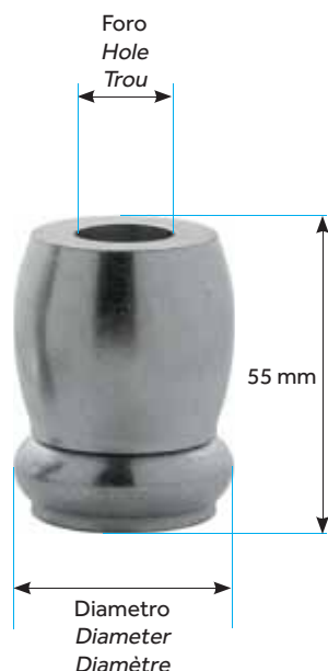
DISTANZIALE CHIUSO ADJUSTABLE CLOSED ENTRETOISES FERMÉ