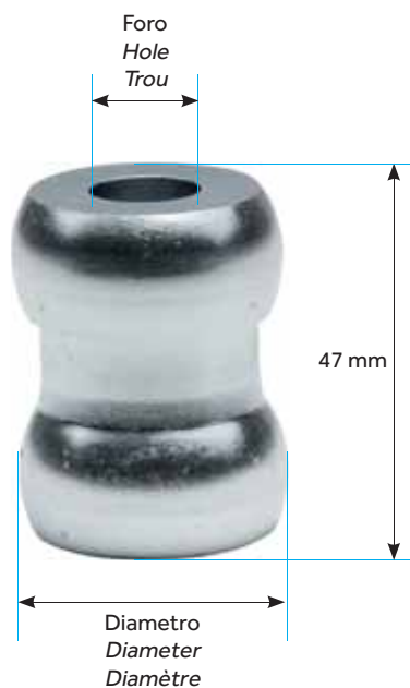
DISTANZIALE APERTO ADJUSTABLE OPEN ENTRETOISES OUVERT