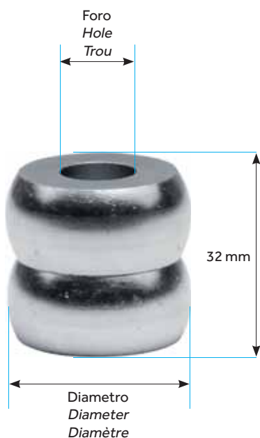
DISTANZIALE CHIUSO ADJUSTABLE CLOSED ENTRETOISES FERMÉ