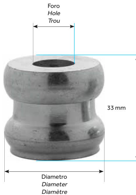
DISTANZIALE APERTO ADJUSTABLE OPEN ENTRETOISES OUVERT