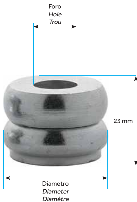
DISTANZIALE CHIUSO ADJUSTABLE CLOSED ENTRETOISES FERMÉ