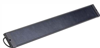
Pannello fotovoltaico MX00PSSWD0B00