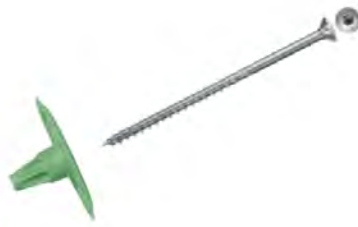
Applicazione con Viti fischer PowerFast II.