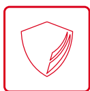
Resistente allo strappo